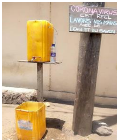
bij gebrek aan waterleiding